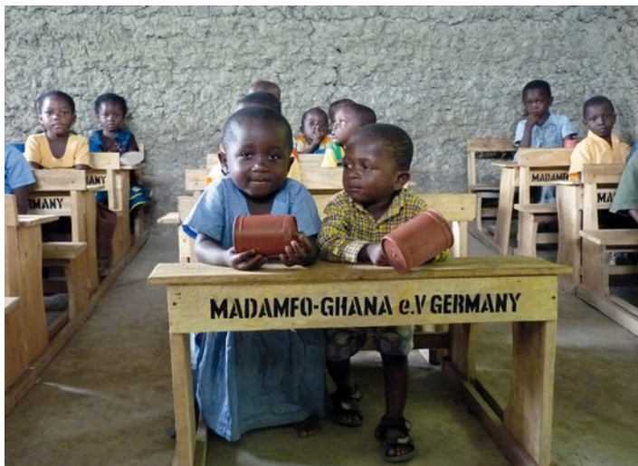
In unserem Schulspeisungsprogramm kochen wir für mehr als 600 Kinder täglich. Kosten: 9.-- € pro Kind im Monat