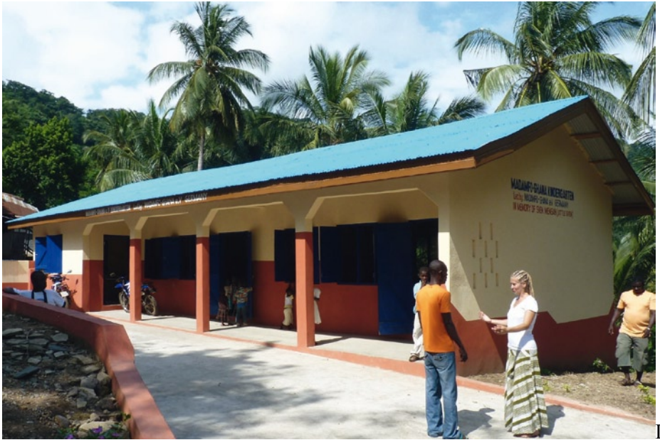
Im Dorf Apewu haben wir den neuen Kindergarten fertiggestellt. Kosten: 16.000.- €