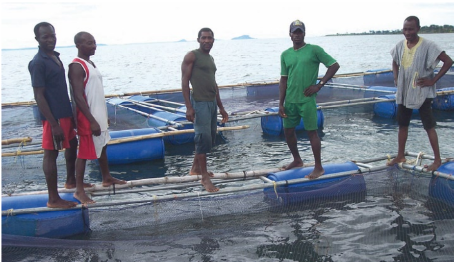
Fischkäfig im Voltasee

Kosten: 3970.-- €/Käfig inkl. Futter, Babyfische, Monitoring