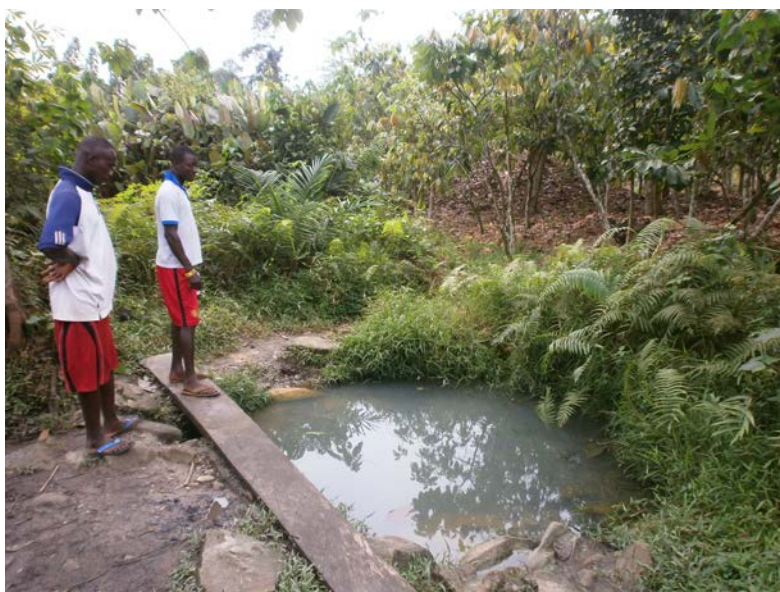
Die derzeit einzige Wasserstelle im Dorf mit ungenießbarem, krankmachendem Wasser!

BITTE SPENDEN SIE GEZIELT FÜR DIESES WASSERPROJEKT! IHRE HILFE WIRD HIER DRINGEND BENÖTIGT!