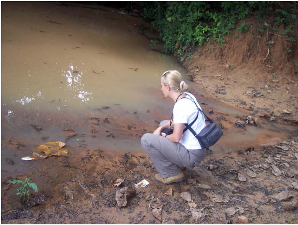
So ähnlich sah die bisherige Wasserstelle aus...