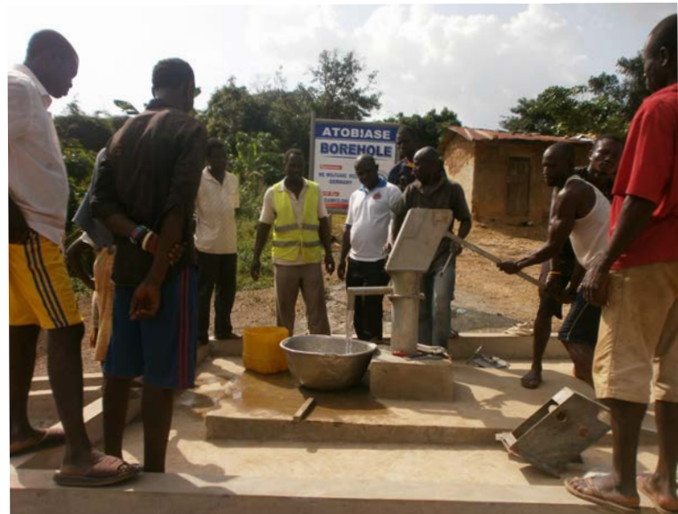
Endlich sauberes Trinkwasser!